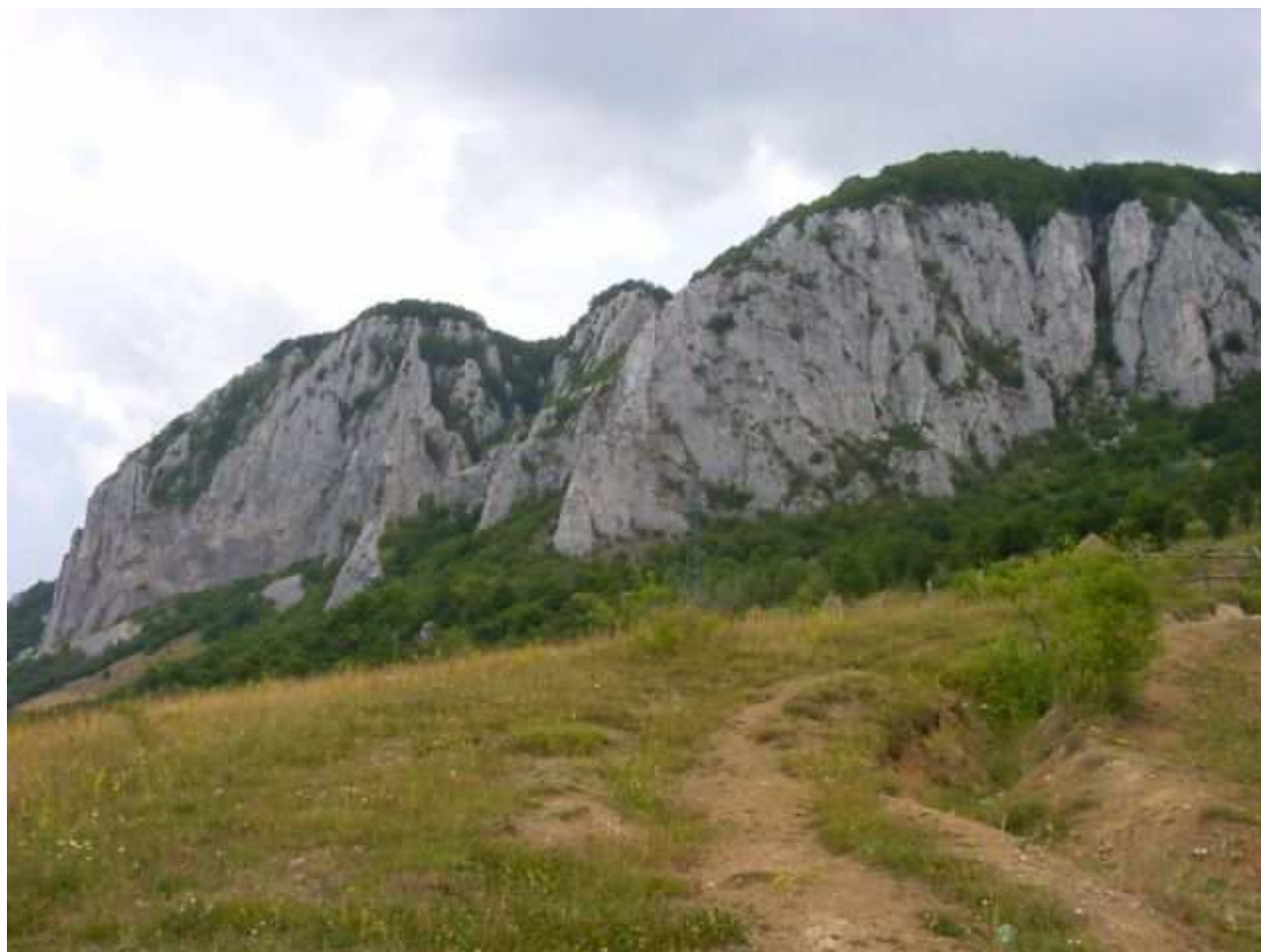
Buceș Vulcan - vedere dinspre pasul Buceș (sud-est)